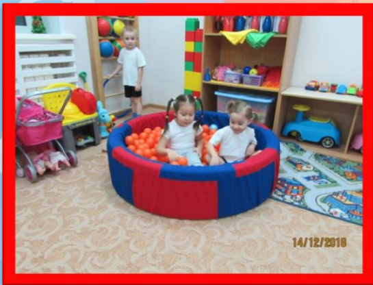
Центр двигательной активности