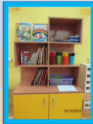
Центр книги и изобразительной деятельности