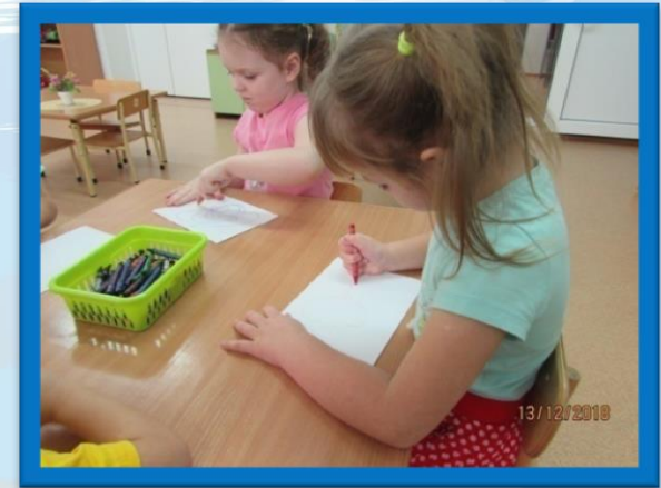
Центр изобразительной деятельности