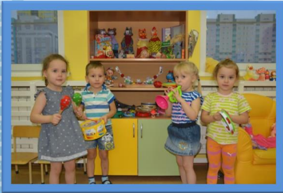
Центр музыкального развития