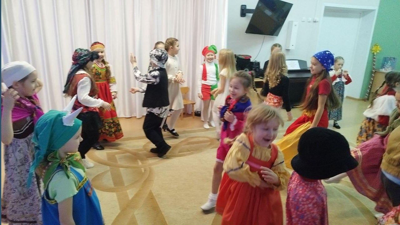
Подвижная игра «Растяпа»