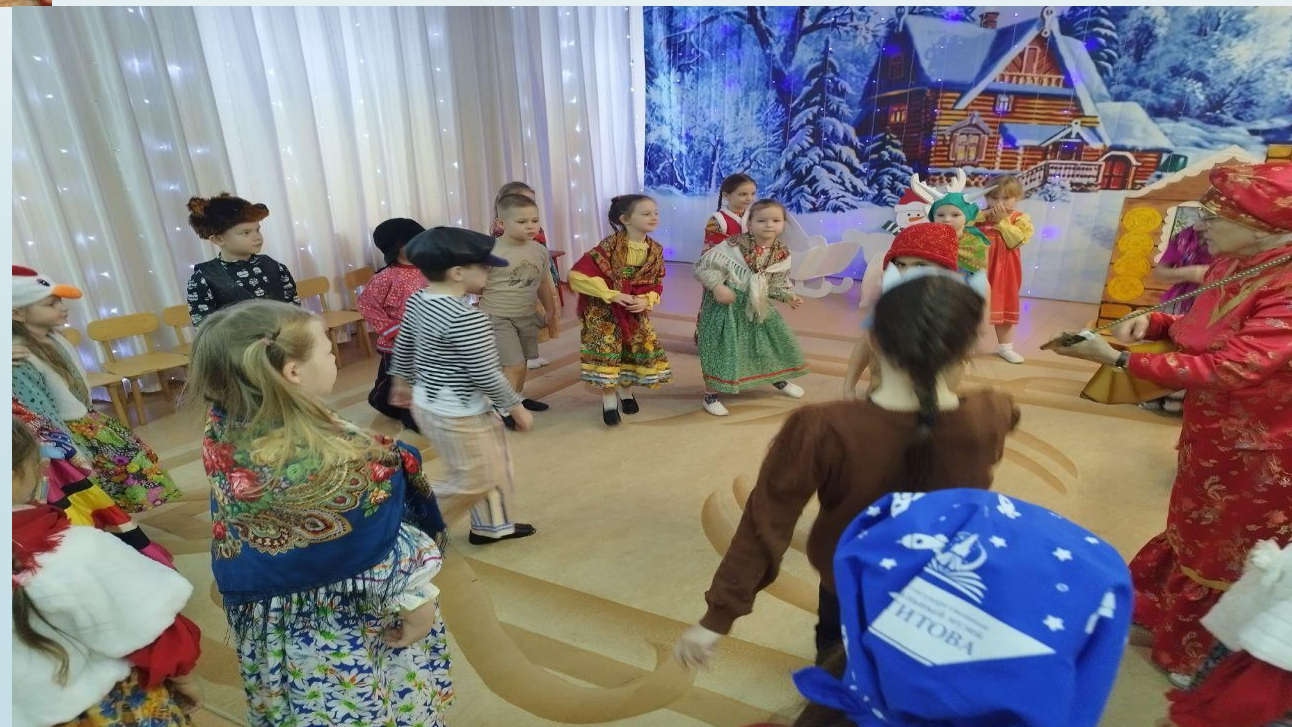
Играем в «Трифона»